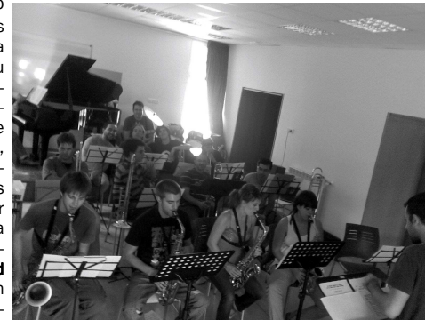
Moment del primer assaig de la BIG BAND

M'agradaria aquest cop contar una història més que escriure un article. La història comença a l'estiu de 2009, quan tres alumnes de l'escola em truquen i em demanem de parlar amb mi. Una tarda, al centre de Reus, m'expliquen com de satisfets havien quedat del Taller d'Estiu fet a l'escola mesos abans, i em proposen muntar una Big Band de forma estable i no com una assignatura de l'escola.