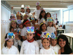
Cèsar August de Tarragona.

El passat diumenge 16 de maig hi va haver El "Juguem Cantant", una trobada de corals organitzada pel SCIC (Secretariat de Corals Infantils de Catalunya) on nens i nenes de tota la província es troben per cantar junts; en aquest cas, la bonica cantata de "El Follet valent". En aquesta ocasió la Trobada va ser al CEIP