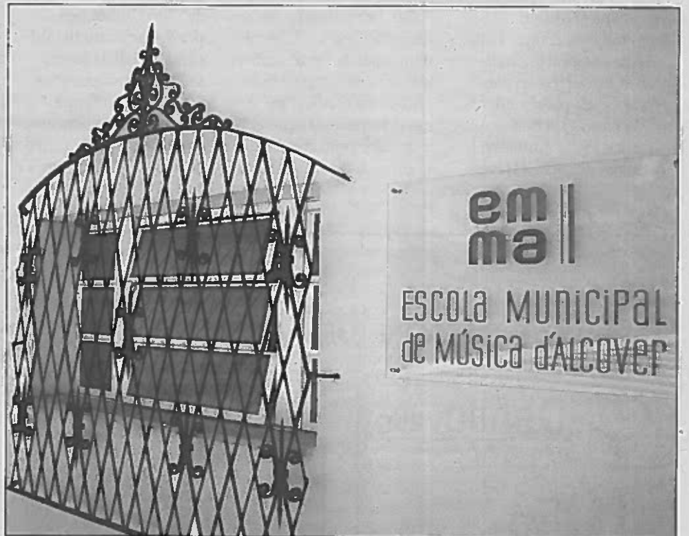
L'enregistrament del disc es farà al Convent de les Arts els dies 10, 11 i 12 d'abril.

La gran estrena serà el dissabte 9 de maig a la tarda al pavelló municipal d'esports. Per donar cabuda a tot el públic esperat, es fa-